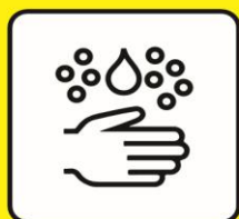
Hande waschen oder desinfizieren